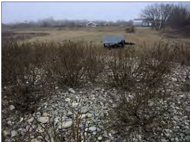
Før roserne dækkes

12 marts 2016. En råkold naturplejedag. Den nordøstlige ende af Tornerosebugten ud for Therosevej 7