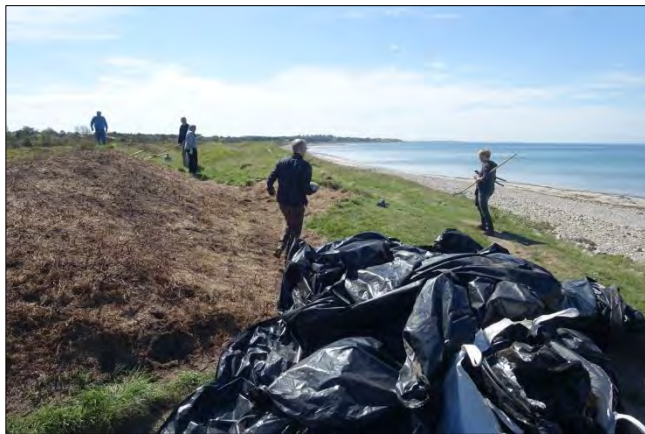
De fleste roser ser ud til at have givet op

På grund af klager over det visuelle har vi besluttet at fjerne plastfolien på en af "topperne" cirka ud for Mosrosevej. Plastfolien har kun ligget i omkring 1 år.