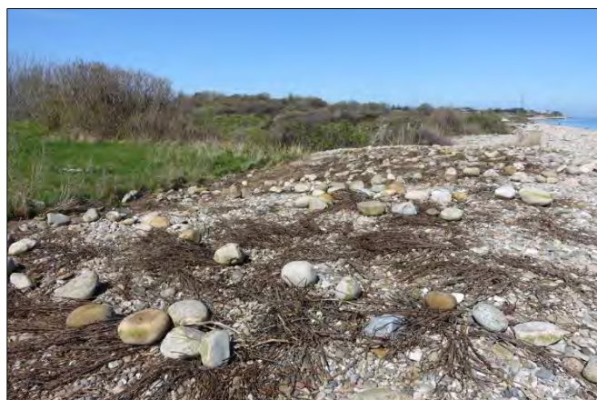
Efter to år under plasticfolien