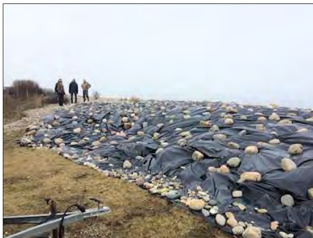
Så skulle det vist kunne klare en kuling