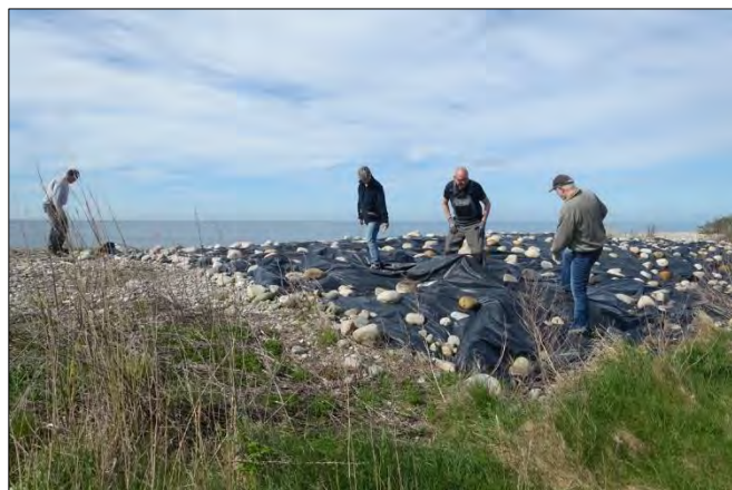
For ikke at slæbe stenene for langt skar vi plasticen i strimler