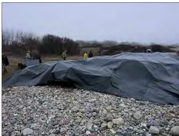
Plasticfolien er trukket over roserne