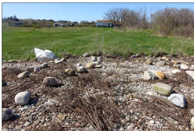
De døde roser kunne fjernes med en rive