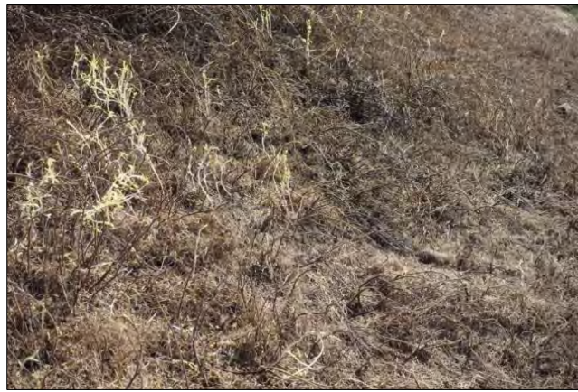
Bleggrønne spirer afslører, at der stadig er lidt kraft i rødderne