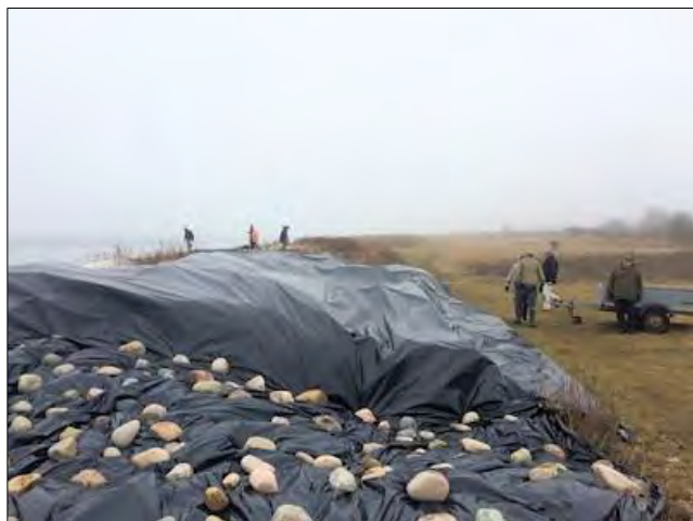
Så lægges der sten på fra en ende af